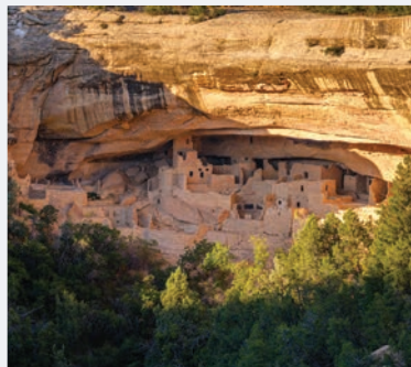
MESA VERDE NATIONAL PARK

4 STUNDEN 45 MINUTEN von Denver entfernt