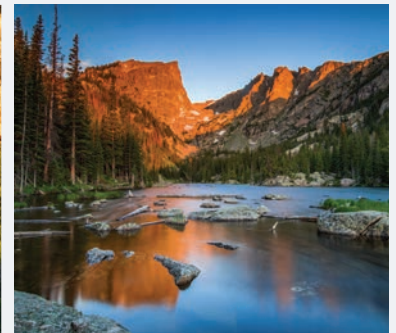
ROCKY MOUNTAIN NATIONAL PARK

4 STUNDEN 45 MINUTEN von Denver entfernt