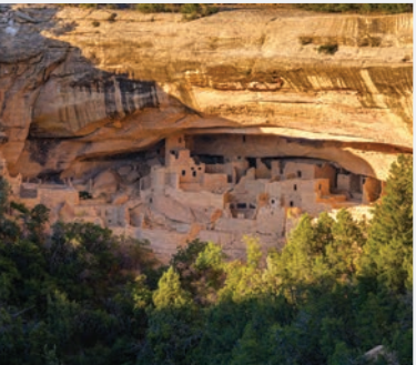
MESA VERDE NATIONAL PARK 4 HORAS Y 45 MINUTOS desde Denver