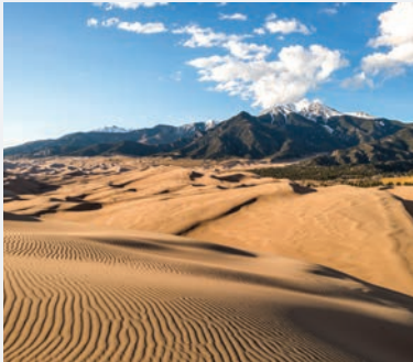
GREAT SAND DUNES NATIONAL PARK AND PRESERVE 4 HORAS desde Denver