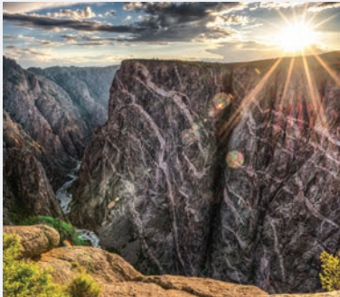
BLACK CANYON OF THE GUNNISON NATIONAL PARK 4 HORAS Y 45 MINUTOS desde Denver