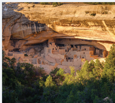
MESA VERDE NATIONAL PARK 6 HORAS E 30 MINUTOS de Denver