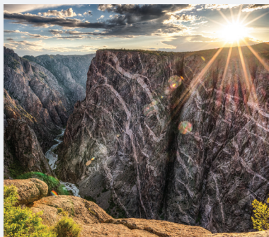
BLACK CANYON OF THE GUNNISON NATIONAL PARK 4 HORAS E 45 MINUTOS de Denver