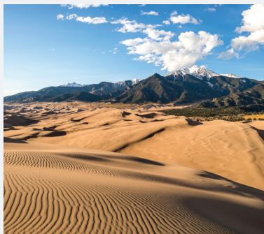
GREAT SAND DUNES NATIONAL PARK AND PRESERVE 4 HORAS de Denver